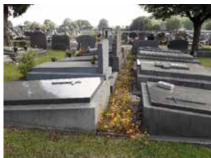
Cimetière de Dieupart – allées enherbées

Ce type de gestion (sans pesticides) requiert certains ajustements quant aux méthodes d'entretien. Les moyens humains et financiers nécessaires peuvent être conséquents, surtout les premières années, c'est pourquoi les aménagements se font progressivement et une certaine tolérance face aux herbes sauvages est requise.