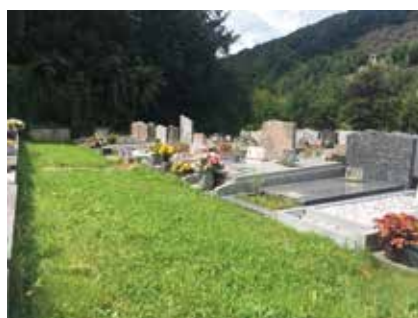
Deux rangées de monuments funéraires au cimetière de Sainte-Walburge (Liège)

Dans les espaces entre-tombes souvent trop étroits pour le passage d'une tondeuse, des plantes couvre-sols ou des vivaces sont parfois installées. Ces techniques permettent de limiter l'entretien et donnent un aspect esthétique intéressant à ces lieux souvent fortement minéralisés. Ce type de plantations sera également testé dans les cimetières de notre commune.